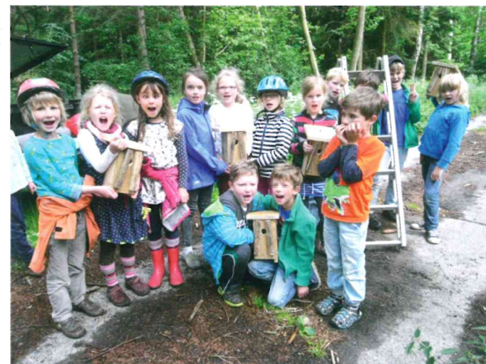
Freie Schule Rügen - Projekte im Rahmen des Wettbewerbs Umweltschule