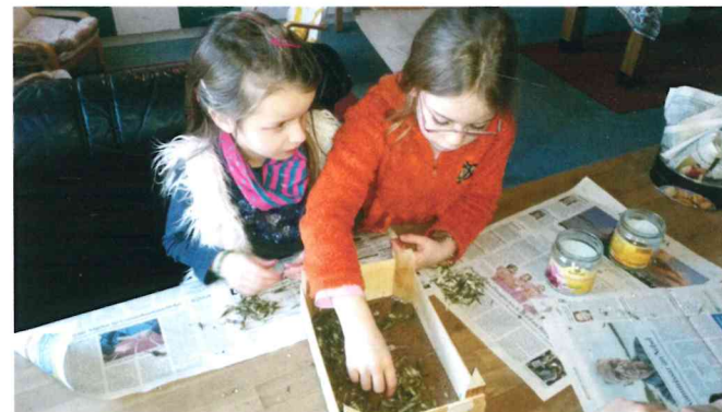
Freie Schule Rügen - Projekte im Rahmen des Wettbewerbs Umweltschule

Die Projektangebote der außerschulischen Lernorte sind interdisziplinär und greifen mehrere Dimensionen der Bildung für nachhaltige Entwicklung auf. Einige der Anbieter*innen sind NUN - Norddeutsch und Nachhaltig - zertifiziert. Weitere Informationen erhalten Sie von unserem Team.