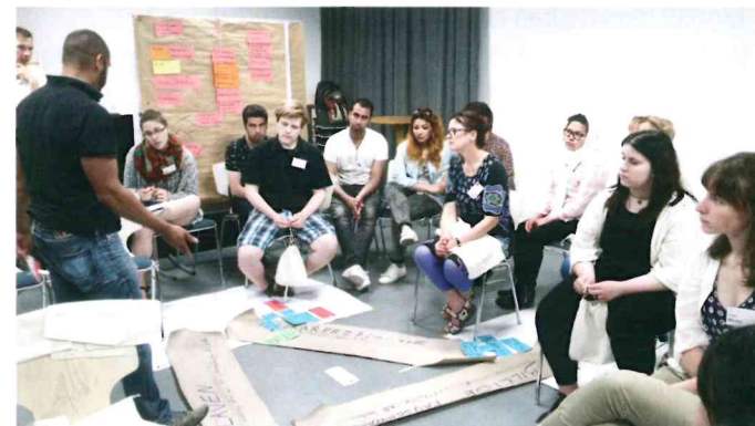
Projekt im Rahmen des Eine-Welt-Landesnetzwerk Mecklenburg-Vorpommern e.V.

Zukunftsfähige Schule gestalten mit BNE fächerübergreifend, inklusiv und interkulturell